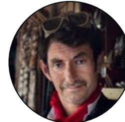
Knacki Deuser* kj-deuser.de