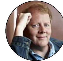
John Doyle* johndoyle.de