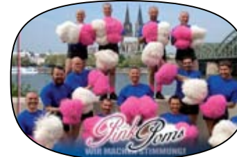
Pink Poms pinkpoms.de