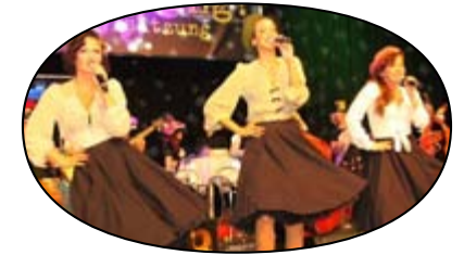
The Kölsch Cats koelschcats.com