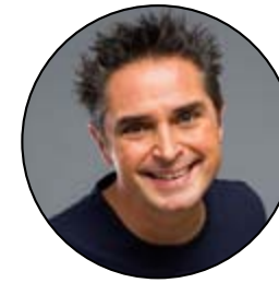
Roberto Capitoni* robertocapitoni.com